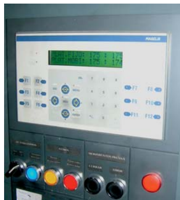
Todas las prensas incorporan control exacto de la temperatura.

No debemos olvidar que nuestro cometido, en cualquier circunstancia, es ofrecerle el mejor material para asegurarle la mayor durabilidad en su aplicación concreta.