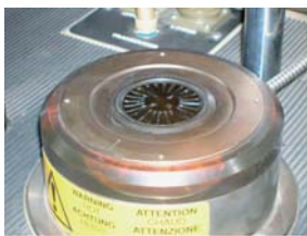
Detalle del Reómetro

Tras más de 25 años de experiencia y gracias a la capacidad técnica de nuestro laboratorio de I+D, hemos desarrollado nuestras propias formulaciones lo que nos permite fabricar juntas adaptadas a los requisitos y a las especificaciones técnicas de nuestros clientes. Para obtener la mejor calidad, para Ustedes, contamos con un equipo de expertos en la fabricación y procesado de elastómeros, así como un laboratorio completamente equipado con las herramientas de medición y prueba necesarias.