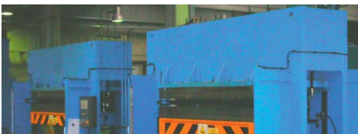
Detalle de dos de las prensas de última generación Laygo gaskets.