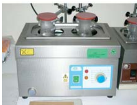
Ensayos por inmersión